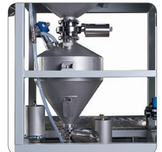
Sendegeäß für Produktförderung